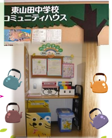
給湯室前にあります！