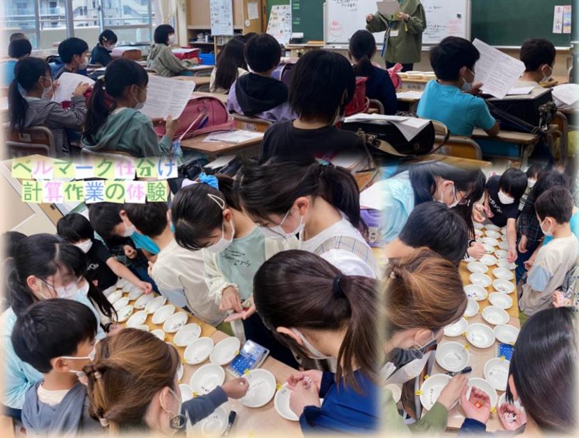
ベルマークの分け 計算作業の体験