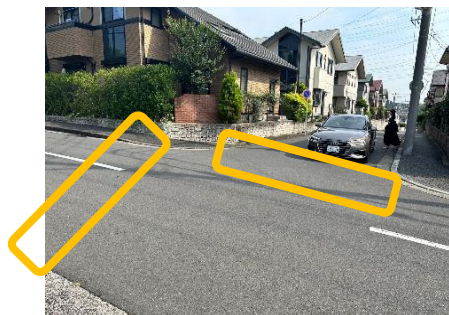
新設希望場所は上記黄色エリア (2か所)